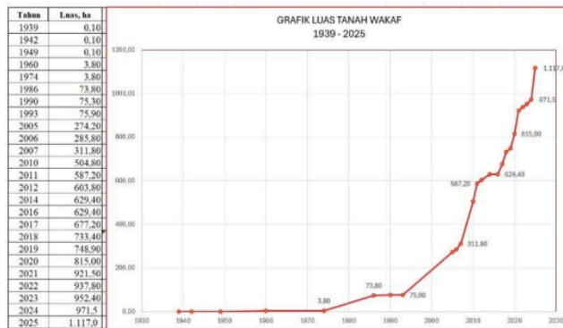
Gambar 1. Grafik Peningkatan Tanah Wakaf Darunnajah

Hasil penelitian menunjukkan bahwa Pondok Pesantren Darunnajah telah berhasil mengembangkan sistem manajemen wakaf produktif yang berperan strategis dalam memperkuat kemandirian lembaga pendidikan Islam. Berdasarkan data kelembagaan tahun 2025, Darunnajah mengelola enam sektor utama wakaf produktif—perdagangan, industri, keuangan, jasa, pertanian, dan peternakan—yang seluruhnya beroperasi dengan prinsip profesionalisme, transparansi, dan akuntabilitas syariah (Manaf, 2022). Total aset wakaf yang dikelola mencapai 1.121 hektar dan memberikan kontribusi sekitar 48% terhadap pembiayaan operasional pesantren.