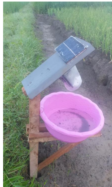
Gambar 2. Hasil Light trap berwarna biru