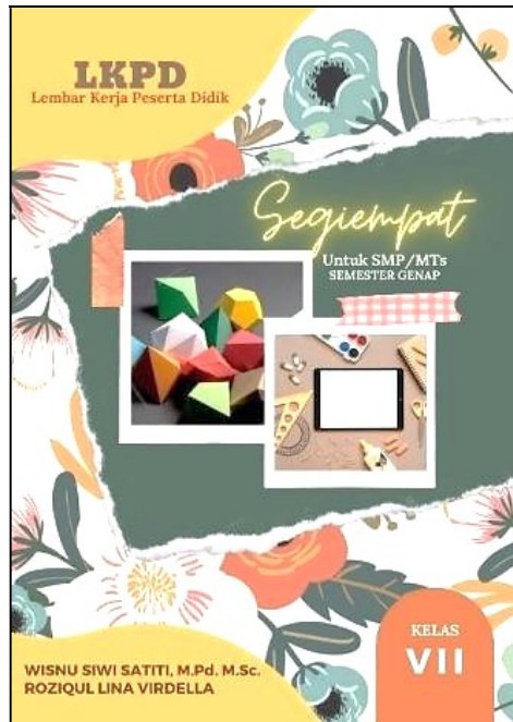
Gambar 2. Cover LKPD