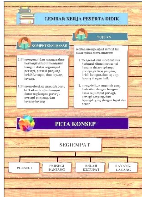
Gambar 3. KD, Tujuan Pembelajaran, Peta Konsep