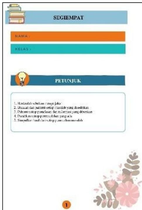
Gambar 4. Petunjuk penggunaan LKPD