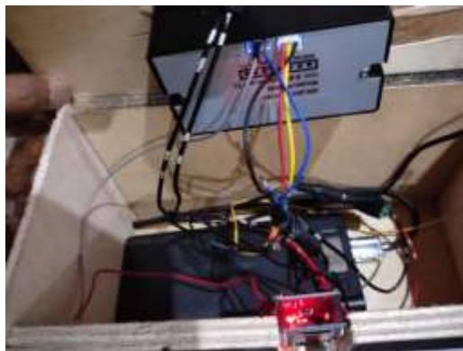
Gambar 5. Tampilan Dalam Alat

Rangkaian keseluruhan dari sistem ini merupakan integrasi dari beberapa komponen utama yang saling terhubung dan dikendalikan oleh mikrokontroler ESP32-CAM. Komponen utama sistem terdiri dari push button, kamera ESP32-CAM, thermal printer, dan web server lokal.