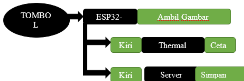
Gambar 1. Diagram Blok

Gambar 1 menunjukkan diagram blok sistem monitoring kendaraan masuk parkir yang terintegrasi melalui jaringan Wi-Fi lokal. Setiap komponen dalam sistem memiliki fungsi dan peran yang saling terhubung untuk memastikan proses monitoring kendaraan dapat berjalan secara otomatis dan efisien. Berikut penjabaran masing-masing komponen yang terlibat dalam sistem: