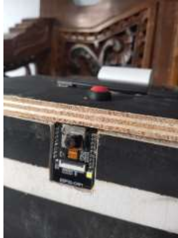
Gambar 4. Alat Sistem Masuk Parkir ESP32-CAM

Gambar menunjukkan tampilan hasil sistem masuk parkir menggunakan thermal printer setelah tombol ditekan dan sistem berhasil mengambil gambar kendaraan yang masuk. Informasi yang dicetak mencakup ID unik kendaraan dan waktu masuk secara real-time. Data tersebut dihasilkan oleh mikrokontroler ESP32-CAM setelah melakukan proses pengambilan gambar dan pengiriman ke web server lokal.