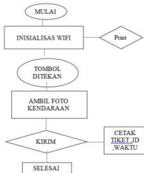
Gambar 3. Flowchart Sistem

Flowchart tersebut menggambarkan proses kerja sistem parkir otomatis berbasis ESP32-CAM mulai dari inisialisasi Wi-Fi, pendeteksian tombol, pengambilan foto kendaraan, pengiriman data ke server,